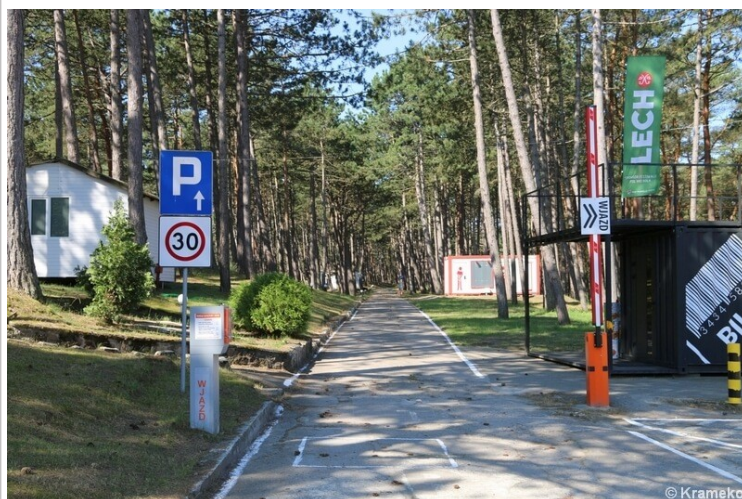
Wjazd na teren ośrodka od ulicy Turystycznej

W okresie funkcjonowania ośrodka (1941-1945) jego teren był pilnie strzeżony i całkowicie niedostępny dla mieszkańców Łeby i osób z zewnątrz. W 1945 roku część obiektów została wysadzona przez wycofujących się Niemców. Na ich miejsce wkroczyli Rosjanie, którzy przez kilka miesięcy penetrowali pozostałości bazy, aby na koniec wysadzić to, czego nie byli w stanie wywieźć do ZSRR. Pomimo tych zniszczeń, badaczom i miłośnikom historii udało się ustalić rozplanowanie oraz funkcje większości obiektów bazy. Największe kontrowersje wzbudza do dziś przeznaczenie dwóch