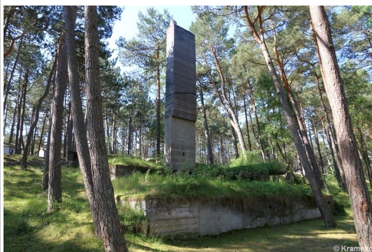
Relikty budynku z kominem