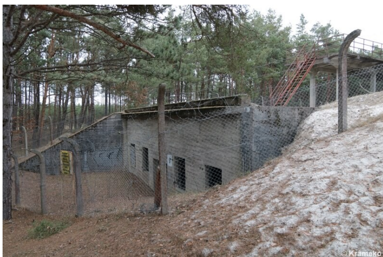
Wejście do wielkiego schronu od zachodu