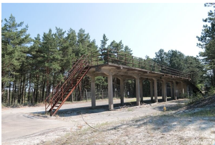
Betonowa płyta nakrywająca wielki schron (rampa powojenna)