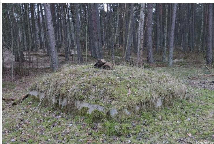
Jedna ze studzienek zbiorników podziemnych