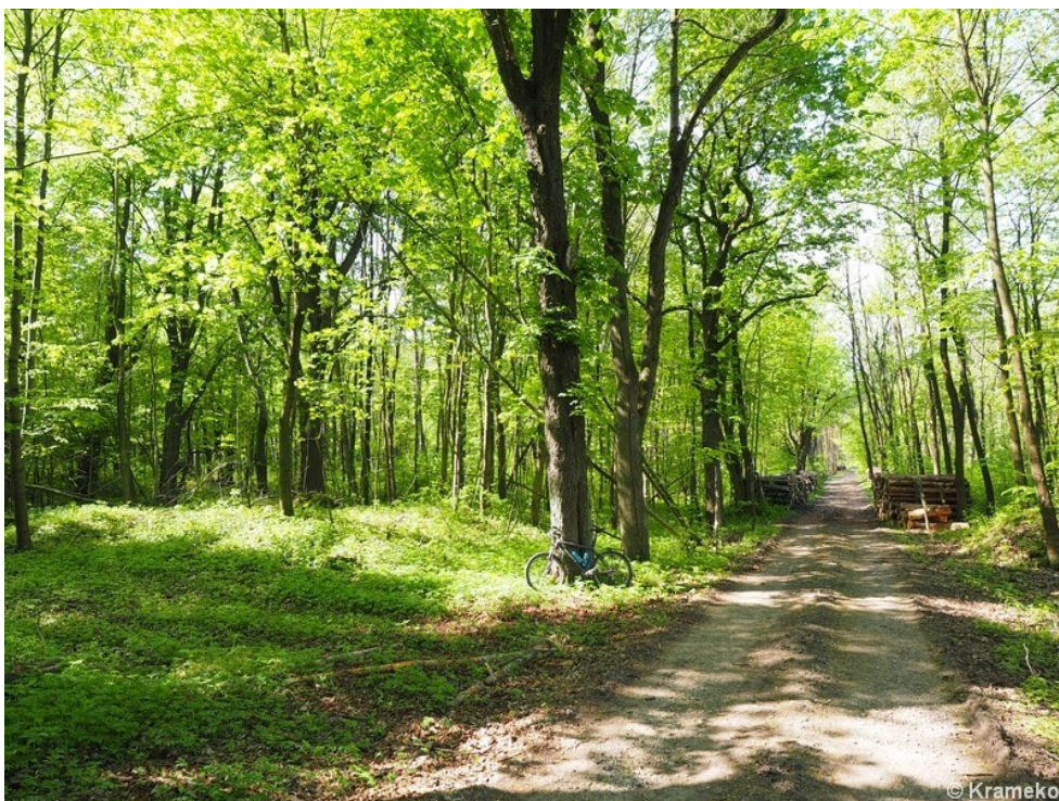
Miejsce po dawnej osadzie (na lewo od drogi)