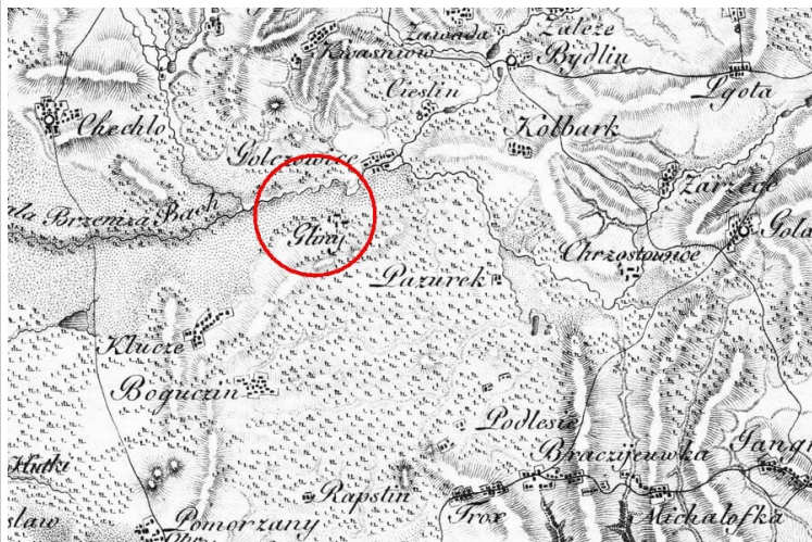
Osada Gliny na Mapie Heldensfelda z początku XIX wieku ( bcul.lib.uni.lodz.pl )