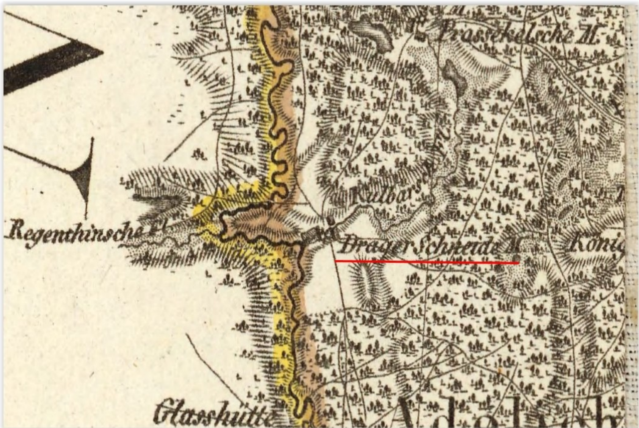
Młyn na mapie Schroettera z 1802 roku [1]