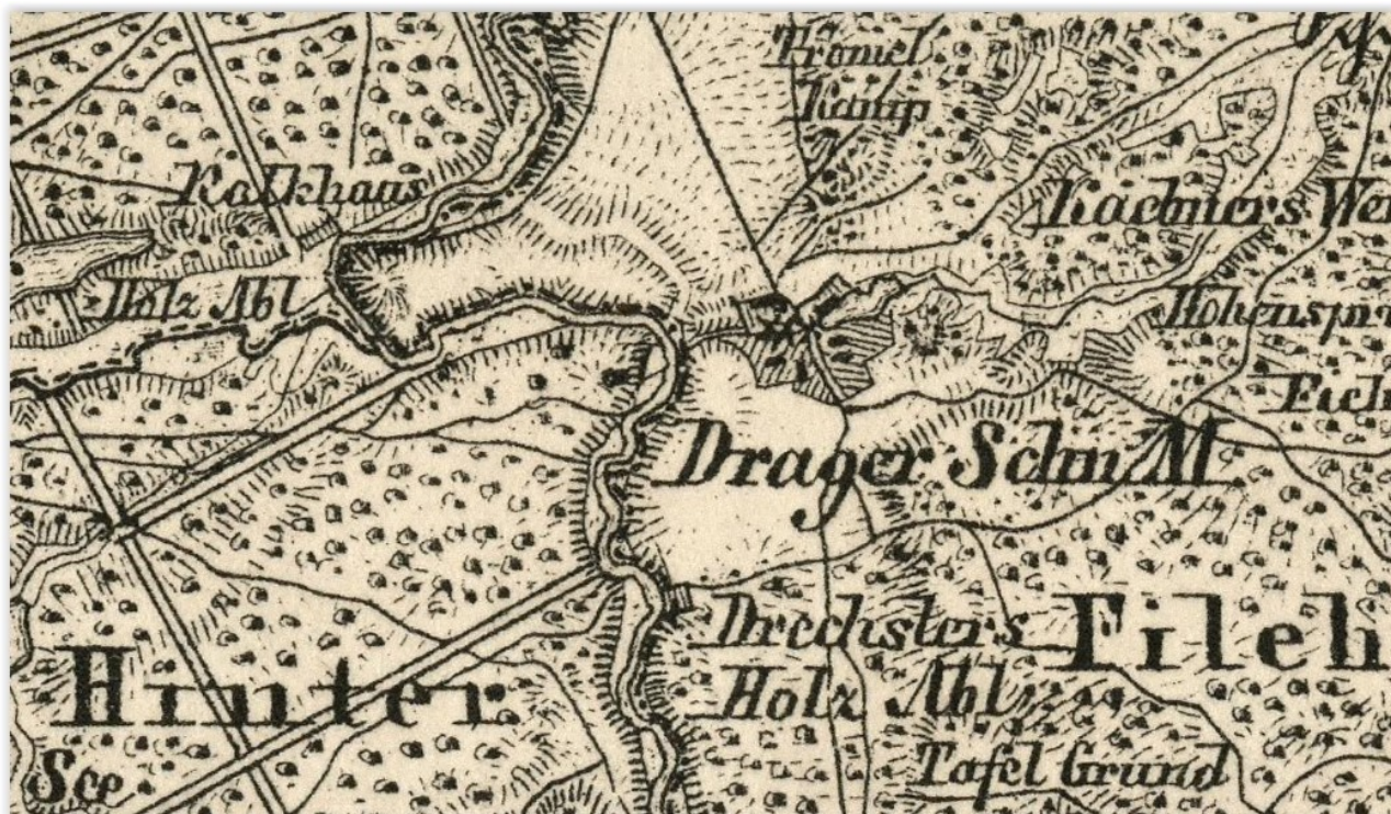
Osada na mapie z 1893 roku [2]