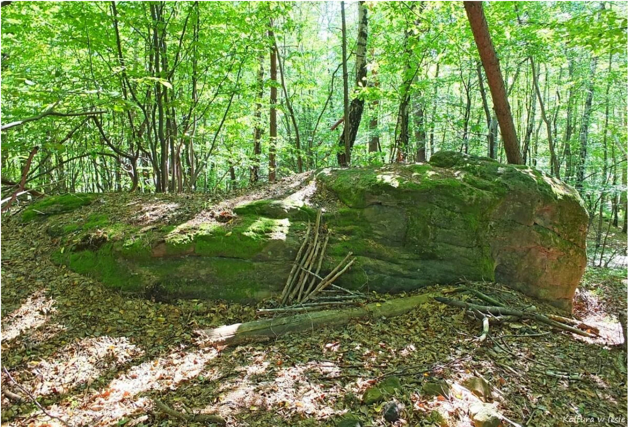
Wychodnie skalne na Duchowej Górze