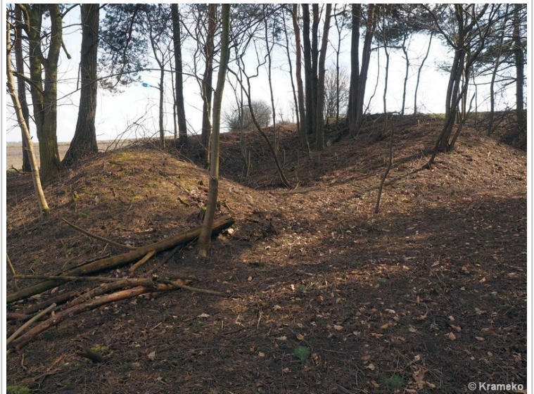
Teren dawnej osady