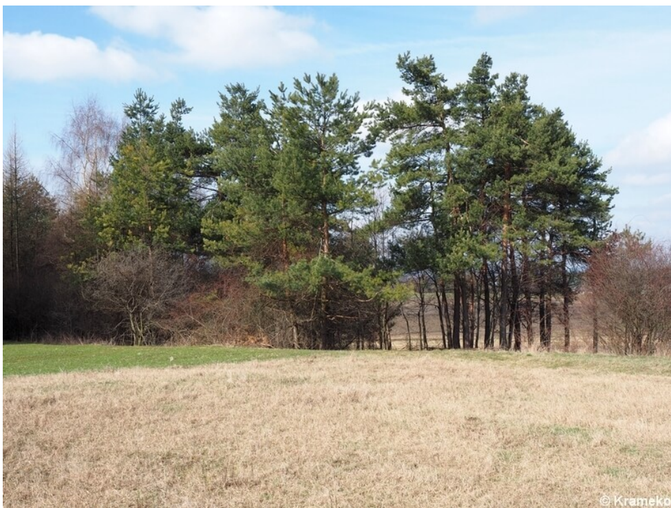
Teren dawnej osady